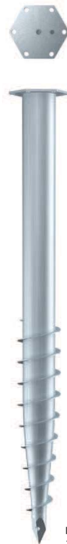
KSF M 76x 1000-M12