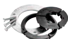
Excentr Set-E80 Položka č. 26814