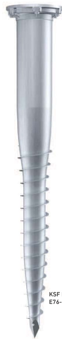
KSF E 140x1300- E76-100