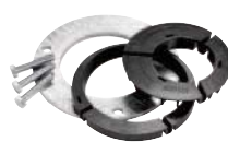
Excentr Set-E90 Položka č. 26813