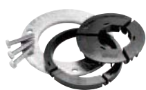
Excentr Set-E76 Položka č. 26810